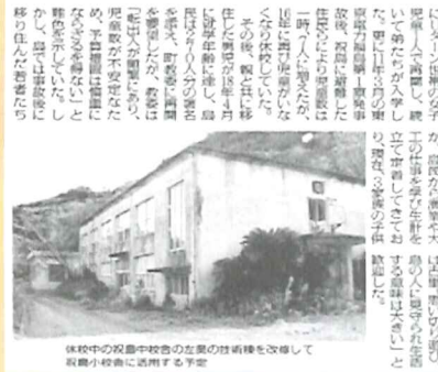
休校中の祝島中学校舎の左奥の技術棟を改修して祝島小学校舎に活用する予定